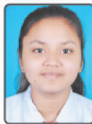
RHYTHM SAH 93.6%