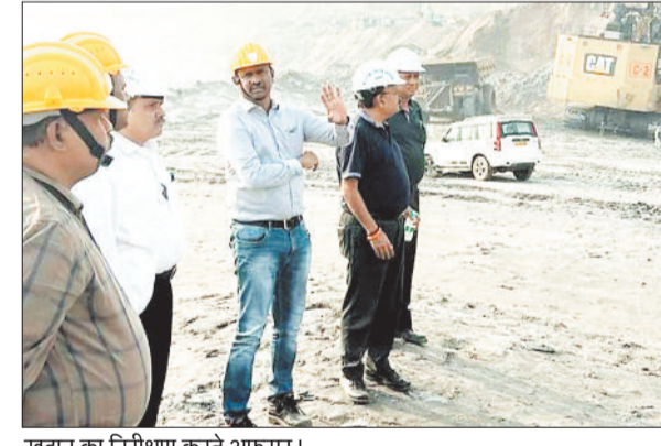
खदान का निरीक्षण करते अफसर।