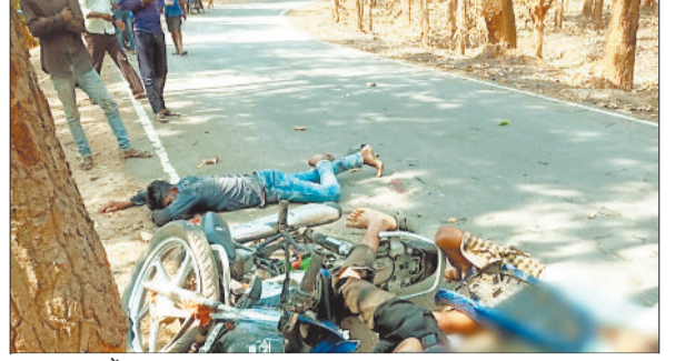
घटनास्थल में मृत पड़ा युवक।