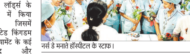
नर्स डे मनाते हॉस्पिटल के स्टाफ।