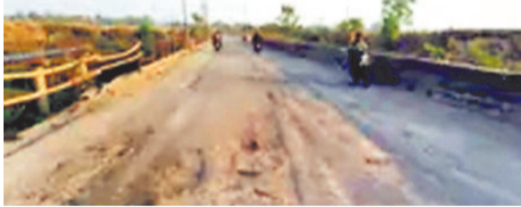
दर्रां मार्ग की कोहड़िया पुलिया बांस बल्ली के सहारे।

अंचल में पुलिया की रेलिंग आधे हिस्से से टूटने के बाद बांस की बल्ली बांध दी गई है। साथ ही पुलिया की डामर भी कई जगह से उखड़ चुकी है। इस कारण मार्ग से गुजरने वाले चालकों को आवाजाही में काफी दिक्कत हो रही है। रात्रि के समय वाहन चालक को वाहन से नियंत्रण खो देने का डर हमेशा बना